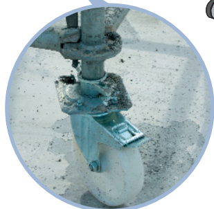
RUEDAS CON FRENO (regulables en altura)