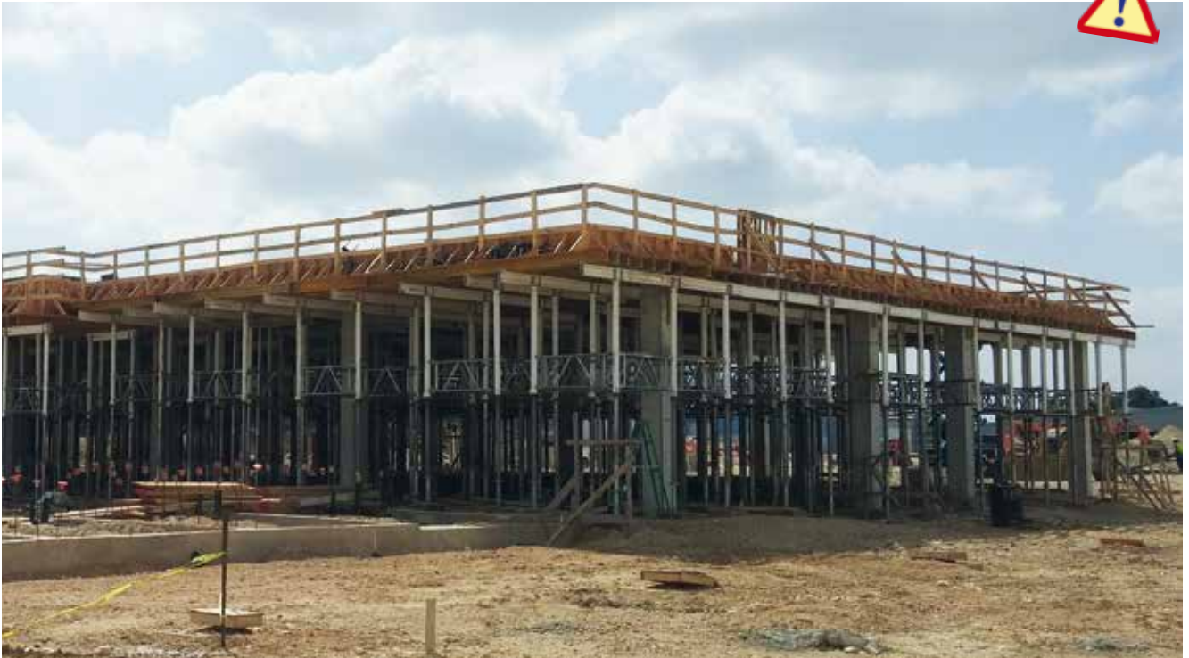
Bell County Expo, Estados Unidos

Sistema novedoso de encofrado de losas con estructura mixta de vigas de madera y aluminio. Incorpora elementos mecanizados para aumentar la productividad en este tipo de sistemas. El Sistema Aluflex utiliza solamente tres elementos básicos (Portasopanda de Aluminio con U's múltiples, viga de madera HT-20 y puntal). Con estos tres elementos y un método de trabajo estudiado y probado por los clientes de Alsina durante más de 30 años, Aluflex es la solución ideal para realizar de la manera más rentable forjados de hormigón.