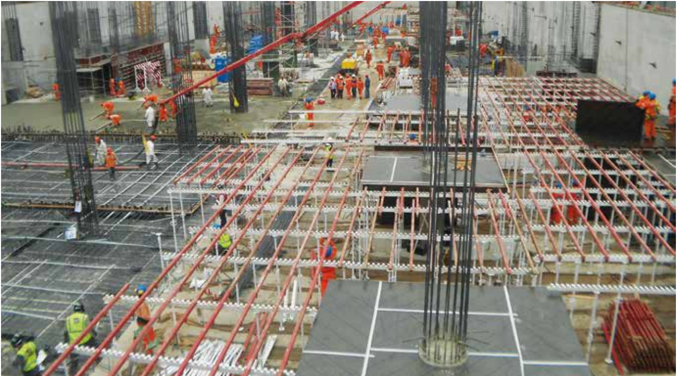
Torre República de Panamá - Surquillo, Perú

Sistema recuperable de alta flexibilidad para adaptarse a cualquier tipo de perímetro.. El Sistema Mecanoflex utiliza solamente dos elementos básicos (Portasopanda con U's Múltiples y Sopanda) Con estos dos elementos y un método de trabajo utilizado por los clientes de Alsina durante más de 30 años, Mecanoflex es la solución ideal para realizar de la manera más rentable forjados de hormigón con cualquier tipo de perímetro.