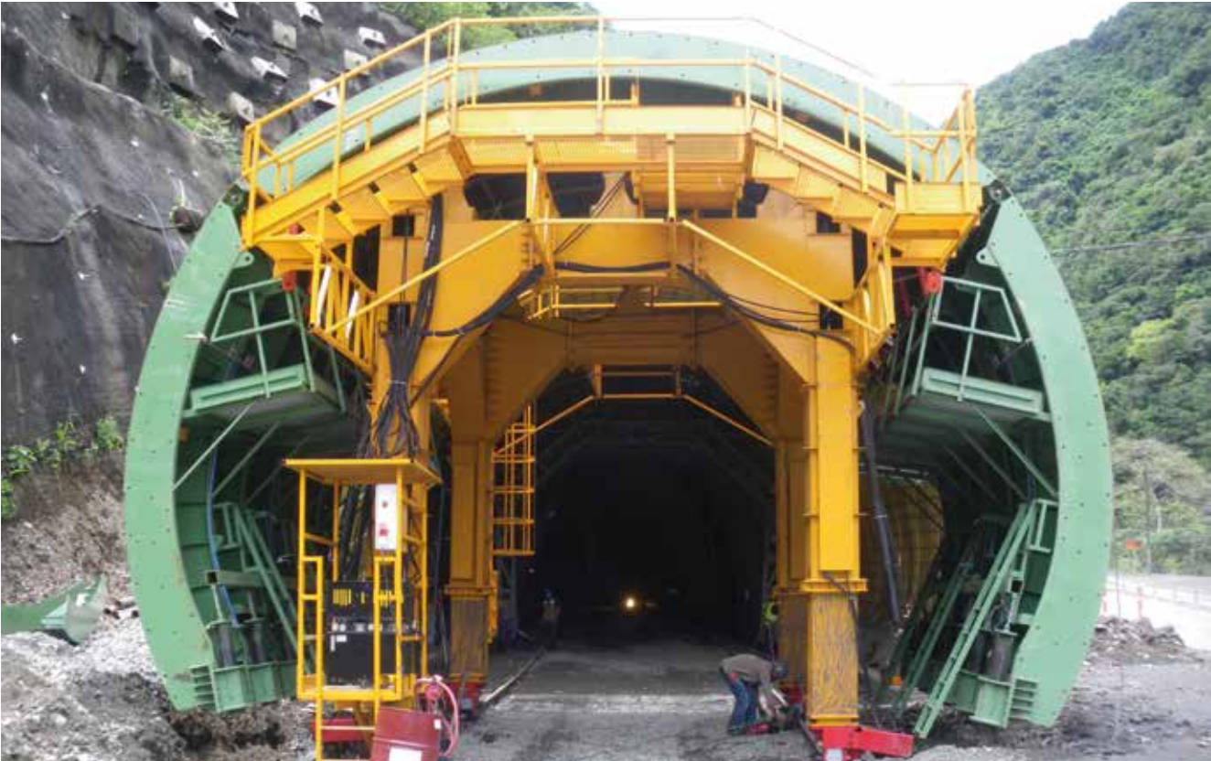
Túnel Cisneros - Loboguerrero, Colombia