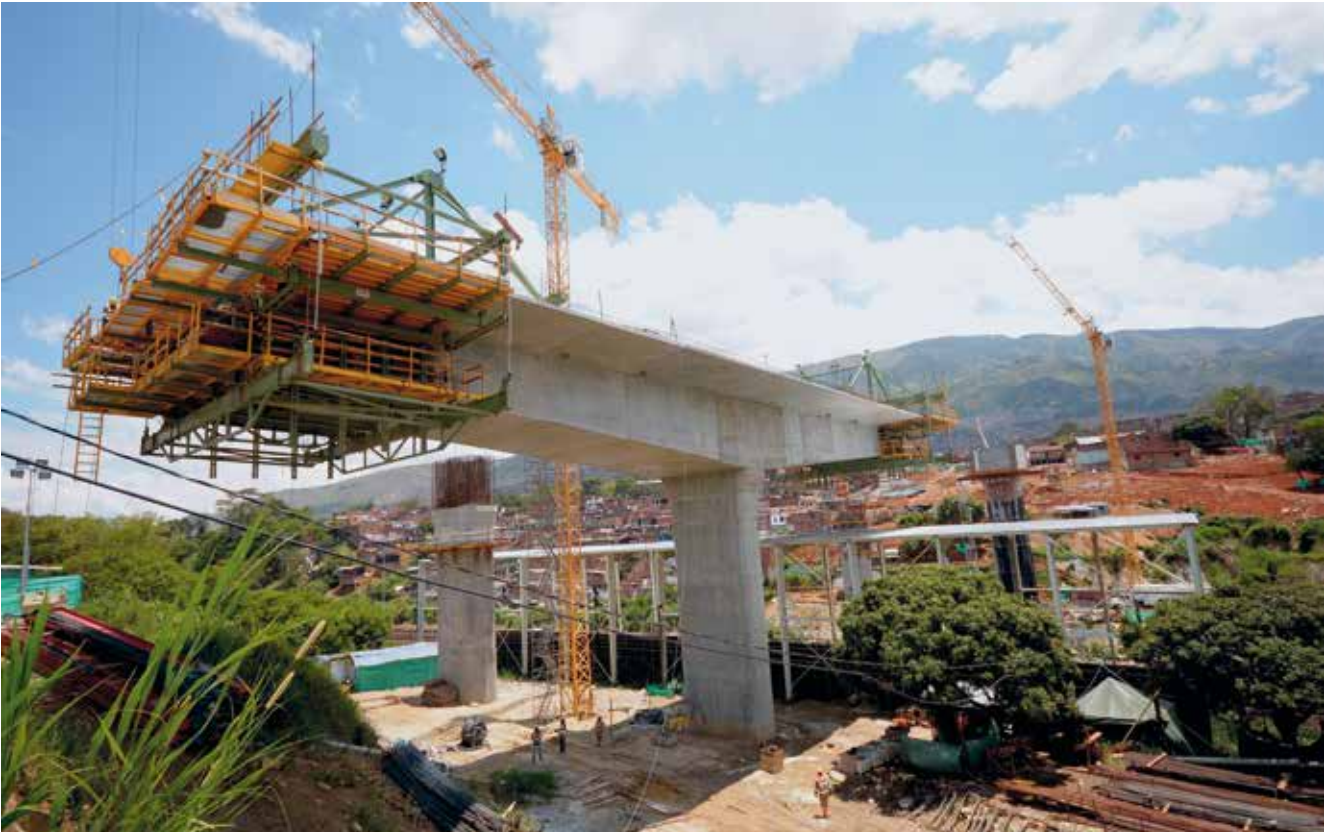
Podul Madre Laura, Columbia