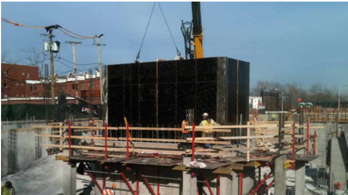
Rezidențial Lakepark Crescent în Chicago, SUA

Sistem conceput pentru realizarea în condiții de siguranță a: cățărărilor interioare pentru cofrarea pililor goale, a puțurilor de ascensor și a oricărui tip de structuri goale cu secțiuni multiple. Principiul de proiectare principal al sistemului cățărător interior este simplitatea: este foarte ușor de asamblat, nu sunt necesare unelte, iar deplasarea este rapidă și simplă.