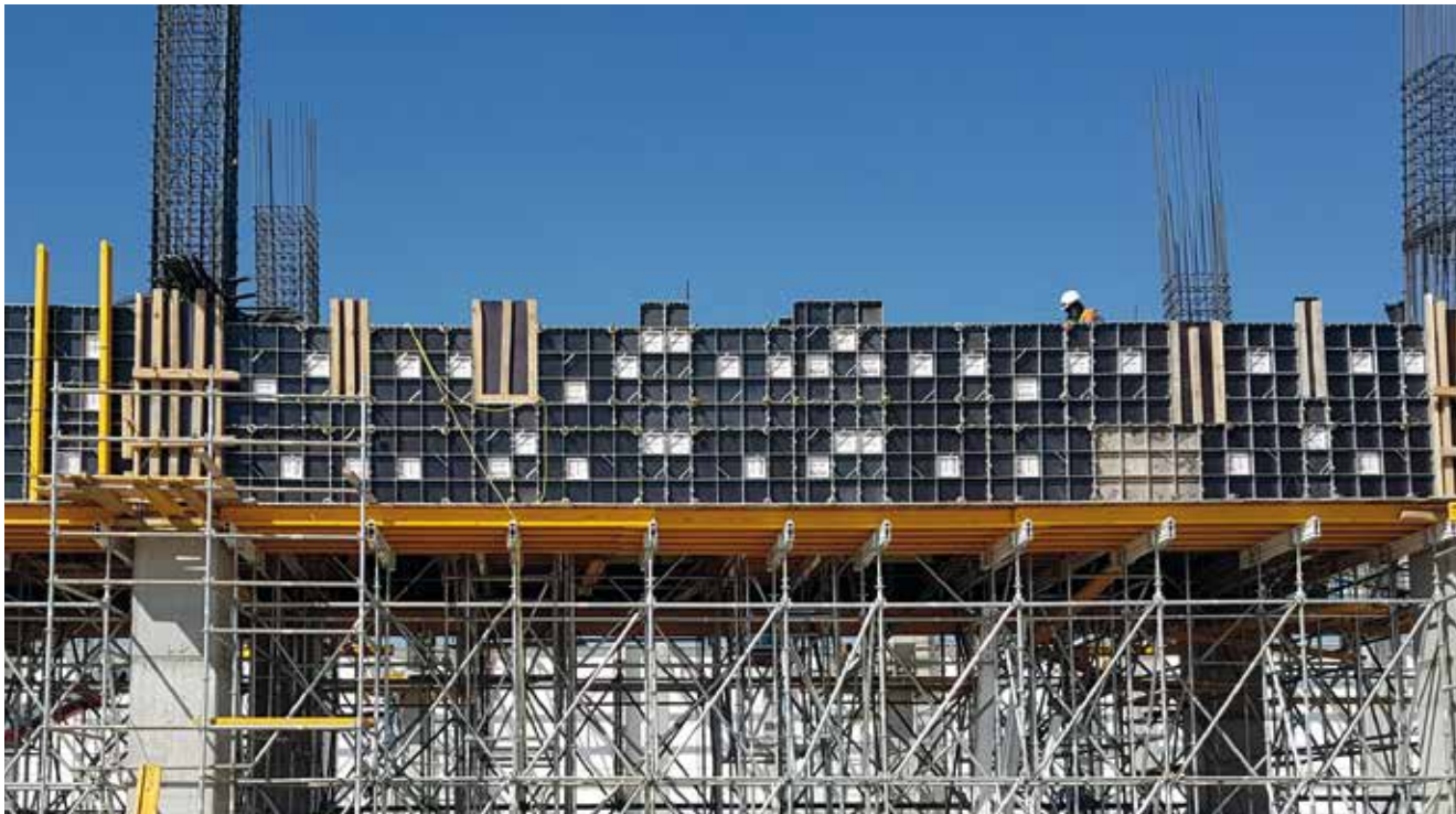
Fabrica de automobile din Jalisco, Mexic

Cofraje ușoare pentru pereți care oferă o versatilitate deosebită și adaptare la orice geometrie. Sistemul dispune de o conexiune rapidă care oferă sistemului productivități mari pentru montare. Cu doar 4 lățimi de panou, un singur colțar și câteva accesorii ușor de montat, poate fi rezolvată orice geometrie.