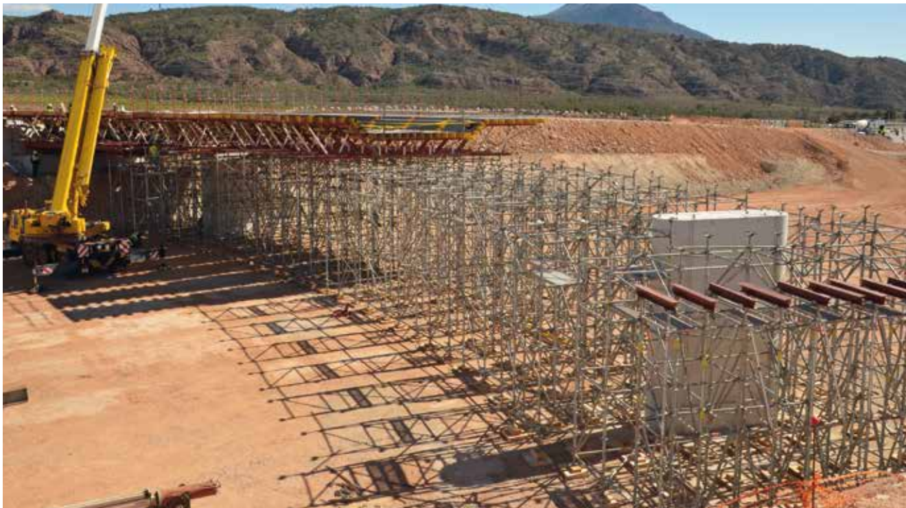
Autostrada A33 Jumilla, Spagna

L'impalcatura di sostegno AR-80 è una struttura di supporto per la cassetta delle solette. La sua principale caratteristica è data dall'elevata capacità di carico: 80 kN per appoggio. Si basa su un sistema di impalcature di sostegno con connessioni multidirezionali. Facile da montare e utilizzata da un vasto collettivo di professionisti, permette il sostegno sia mediante torri indipendenti che con orditure di sostegno a torri solidali, a seconda delle esigenze di ogni applicazione.