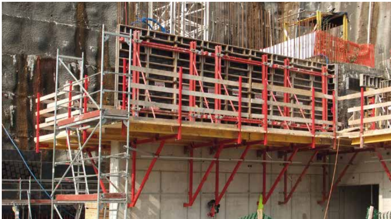
Centro Culturale a Lugano, Svizzera

Elemento progettato per riprendere la casseratura in stese di cemento fino a 6 m di altezza con la totale sicurezza dell'operatore. Può essere posizionato mediante due sistemi di ancoraggio, ovvero utilizzando barre M-24 oppure coni metallici con tirante a perdere nel calcestruzzo. È compatibile con i sistemi di casseratura di muri Alisply Muri, Alisply Circolare e con il sistema Multiform Verticale.