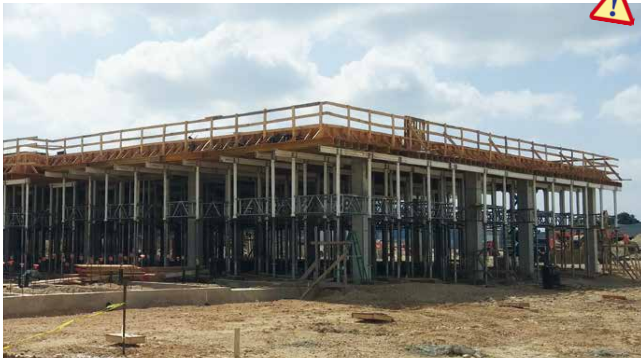
Bell County Expo, Stany Zjednoczone

Innowacyjny system deskowania płytowego o mieszanej konstrukcji z belek drewnianych i aluminiowych. Zawiera mechaniczne elementy w celu zwiększenia wydajności w tego typu systemach. System Aluflex wykorzystuje tylko trzy elementy podstawowe (aluminiowa belka wzdłużna z ceownikami, drewniana belka HT-20 i stempel). Dzięki tym trzem elementom i przeanalizowanej i wypróbowanej metodzie pracy wykorzystywanej przez klientów firmy Alsina od ponad 30 lat, Aluflex jest idealnym rozwiązaniem do wykonywania w najbardziej opłacalny sposób stropów betonowych.